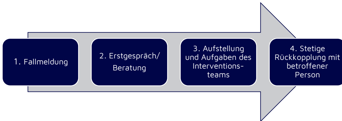
Abb. 1: Vereinfachte Darstellung eines Interventionsprozesses (vgl. Inmedio; JUH, 2022)